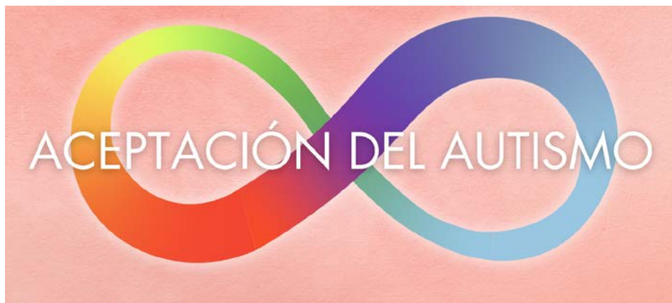
Ilustración de Canva

Estas luchas no son exclusivas de mí. Las personas autistas vivimos en un mundo que no está hecho para nosotros, por eso las relaciones son tan difíciles de entender. Hay que leer entre líneas y, a veces, la gente no dice lo que piensa. No es socialmente aceptable dar información sobre tus intereses especiales o ser