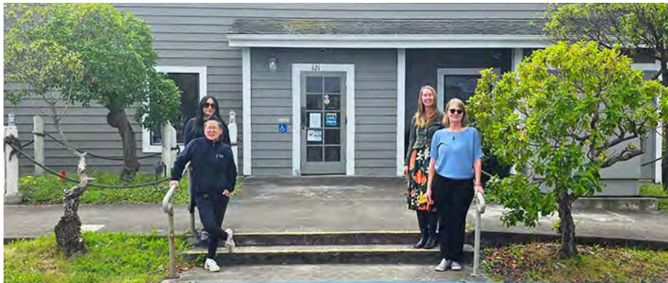
Empleados del RCRC de Fort Bragg en la nueva oficina.

Sirviendo a los condados de Del Norte, Humboldt, Lake y Mendocino