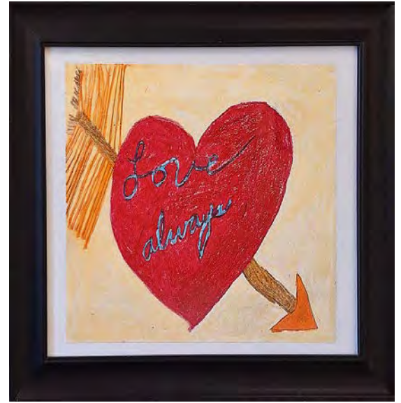
Con amor siempre, Connie Breedlove