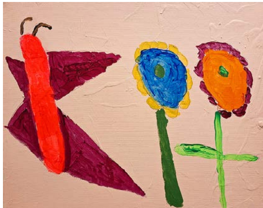
Flores grandes, acrílico sobre lienzo. Cindy Tirsbeck

Trajectory es un programa de desarrollo profesional para las artes visuales, literarias y escénicas en el condado de Humboldt, California, y forma parte del The Ink People Center for the Arts.