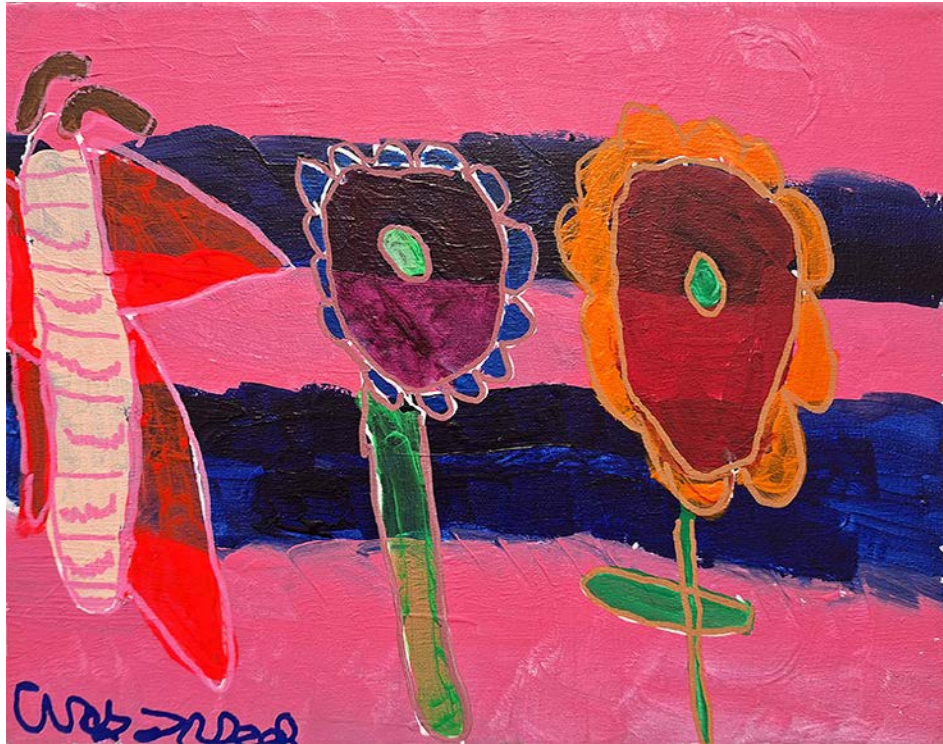
Mariposas y rayas, acrílico sobre lienzo. Cindy Tirsbeck

Sirviendo a los condados de Del Norte, Humboldt, Lake y Mendocino